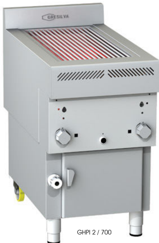
GHPI 2 / 700