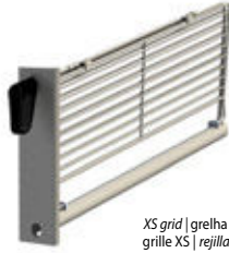
XS grid | grelha XS grille XS | rejilla XS