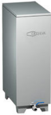
Mod TV 2