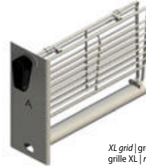
XL grid | grelha XL grille XL | rejilla XL