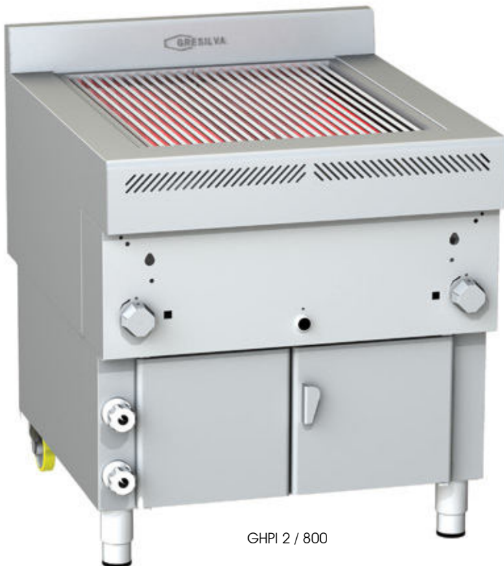
GHPI 2 / 800

Sinta o aroma de um grelhado 100% natural