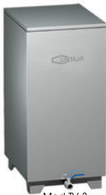
Mod TV 3