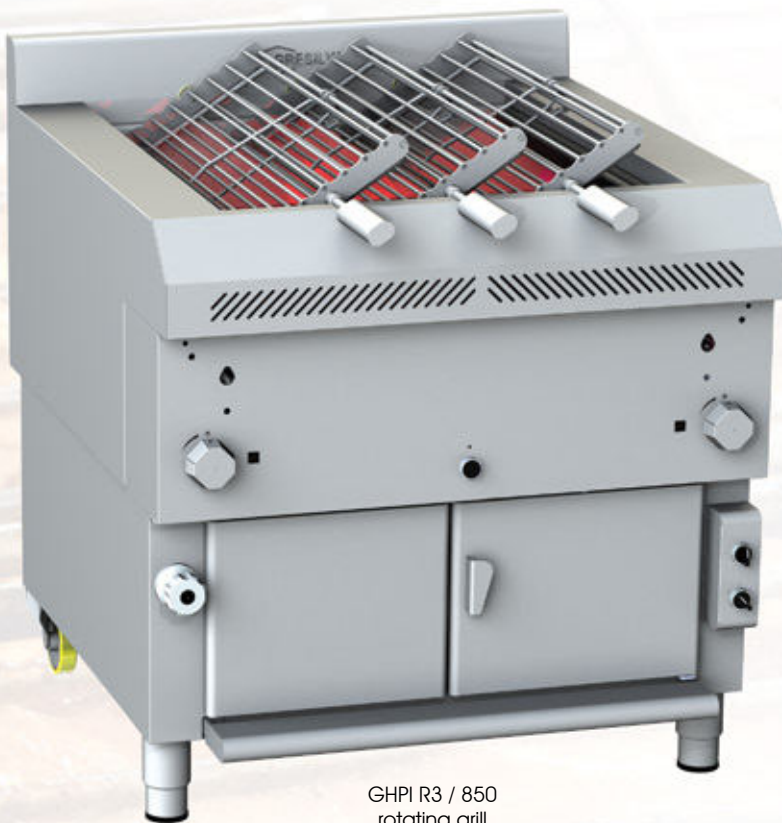
GHPI R3 / 850 rotating grill