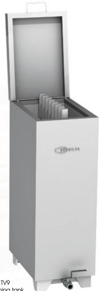
Mod TV9 Grid cleaning tank

The GRESILVA® ROTATING GRILL R3 , although it has no horizontal grill, it allows three rotating grids for spatchcock chicken at the same time in a small space.