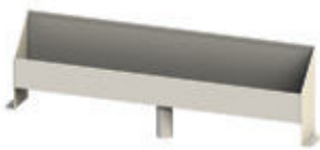
gutter | caleira gouttière | calera