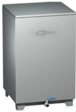
Mod TV 4