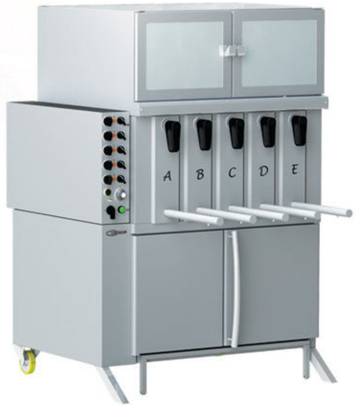
Mod GV 5