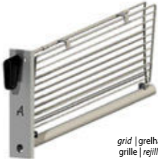
grid | grelha grille | rejilla