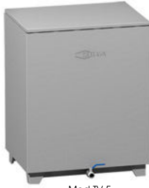
Mod TV 5