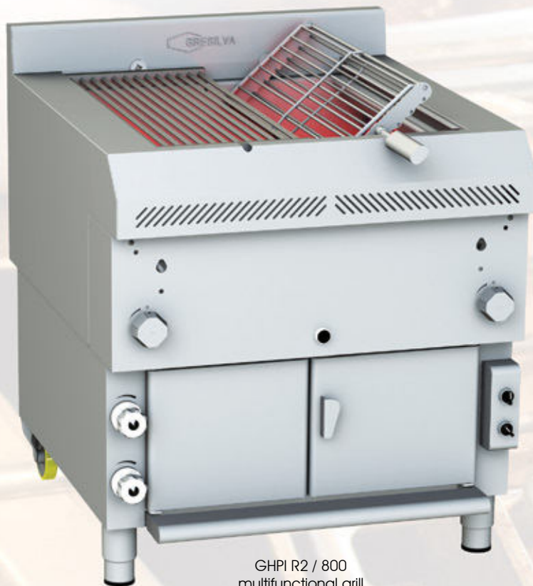
GHPI R2 / 800 multifunctional grill