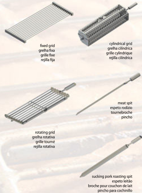
fixed grid grelha fixa grille fixe rejilla fija