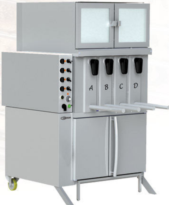
Mod GV 4

Winner of a gold medal at the International Exhibition of Nuremberg IENA 81 - Germany PREMIADO com medalha de ouro na Exposição Internacional de Nuremberg IENA 81 - Alemanha A REÇU LE PRIX avec une médaille d'or dans l'Exposition Internationale de Nuremberg IENA 81 - Allemagne PREMIADO con medalla de oro en la Exposición Internacional de Nuremberg IENA 81 - Alemania