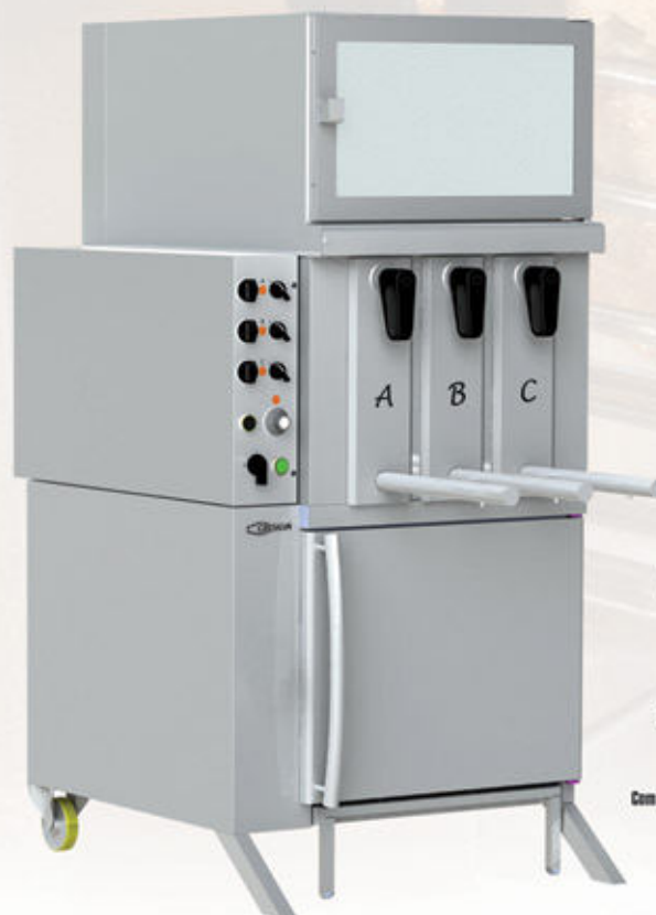
Mod GV 3