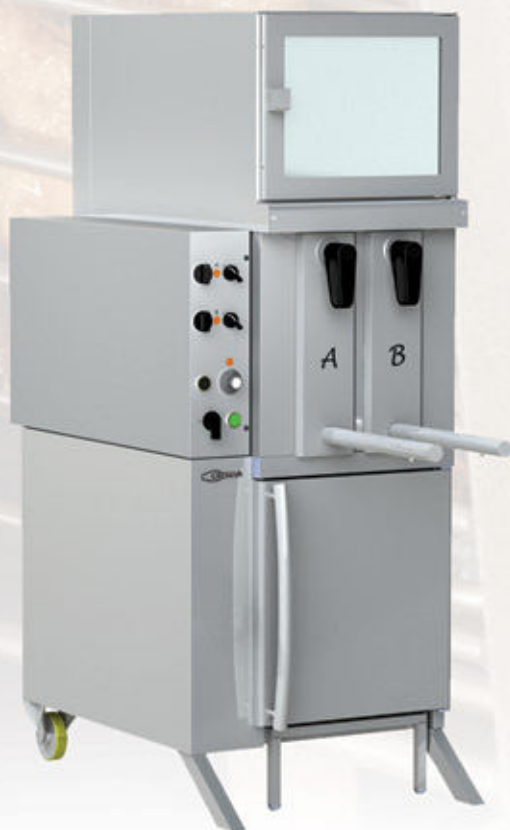
Mod GV 2